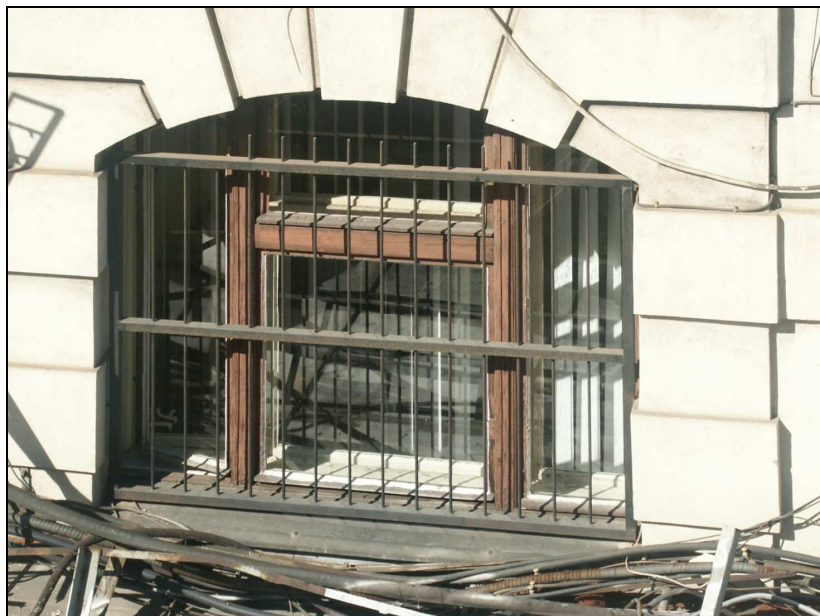
celkový pohled z exteriéru